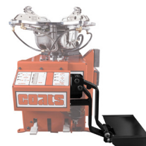
轮胎举升装置 (PN 85608609)