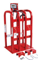
专用安全气装置 (PN 85607770)