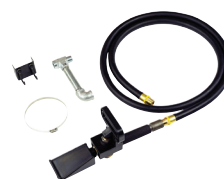
暴充辅助装置(ABS) (PN 85606545)